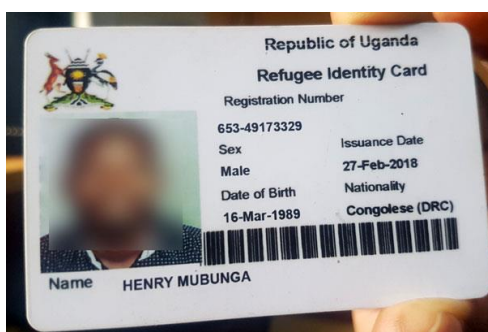
Periódico ugandés "Monitor", 2019

Muy a menudo, las poblaciones migrantes carecen de documentos de identidad cuando llegan. Los pierden, se los roban o no se los expidieron cuando partieron. La tarjeta de identidad de refugiado es, en teoría, reconocida por las entidades financieras. Pero a menudo no es suficiente para garantizar el acceso: barreras tecnológicas en las entidades financieras (sistema de información), procedimientos administrativos, discriminación en ventanilla con respecto a la población migrante.