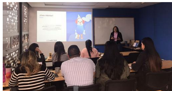
Formación para el equipo técnico del IRC sobre inclusión financiera

Por último, se llevaron a cabo actividades de información y capacitación para instituciones financieras sobre las especificidades de las finanzas para refugiados con la selección de dos instituciones financieras ( Cooperativa Financiera -CFA- y Crezcamos ) para implementar el apoyo de la SparkassenStiftung en el marco de un diagnóstico detallado de su situación actual y la formulación de recomendaciones destinadas a adaptar mejor sus políticas, procedimientos y servicios a la población migrante. También se han implementado iniciativas de formación e intercambio para actores de la cooperación y de la sociedad civil con la Oficina del Alto Comisionado de las Naciones Unidas para los Refugiados (ACNUR) y la ONG International Rescue Committee (IRC) .